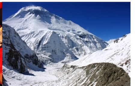
峠越えはコース第2のハイライト

ご旅行予定 2012年4月26日(木)～5月12日(土) 17日間 ご旅行費用 4名以上ご参加の場合 ¥650,000 ※最少催行人員:4名 ※燃油サーチャージ、空港税など別途必要です 目安¥31,000