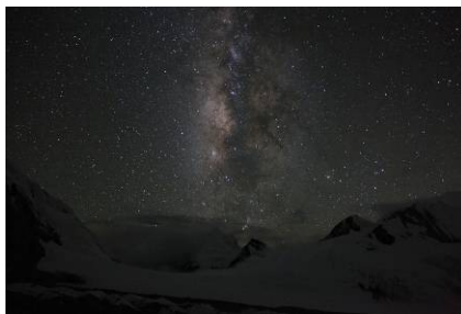
BCからの星空は格別

今春、 竹内洋岳 が8000m14座達成を目指して最後のダウラギリへ挑戦！ 最後の一座、無事登頂を果たしてもらおうべく、 ベースキャンプまで激励 しに行きましょう。 登頂できるかどうかはあなた自身にかかっている…！？現地で 熱く 応援しよう！！